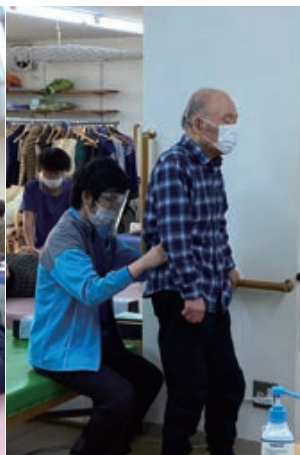
▲個別リハビリ(バランス訓練)