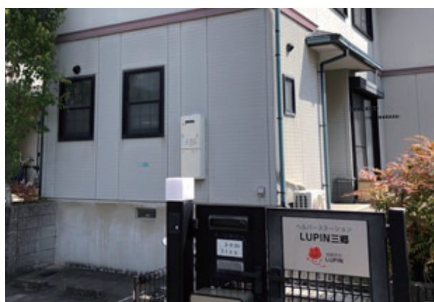
ヘルパーステーション LUPIN 三郷