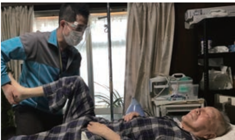
▲ベッド上での個別機能訓練