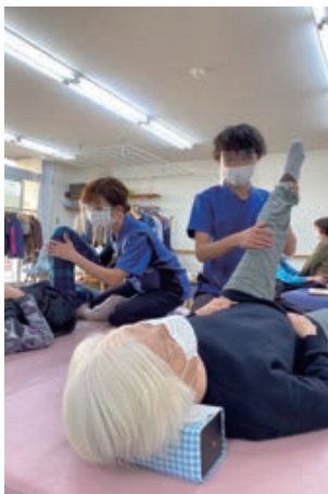
▲個別リハビリ(ベッド上)