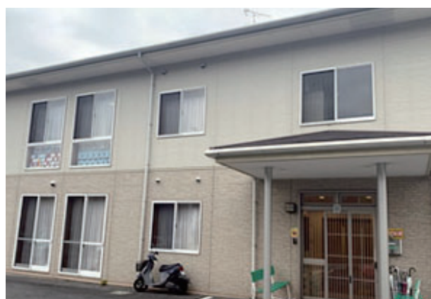
グループホーム LUPIN 平群