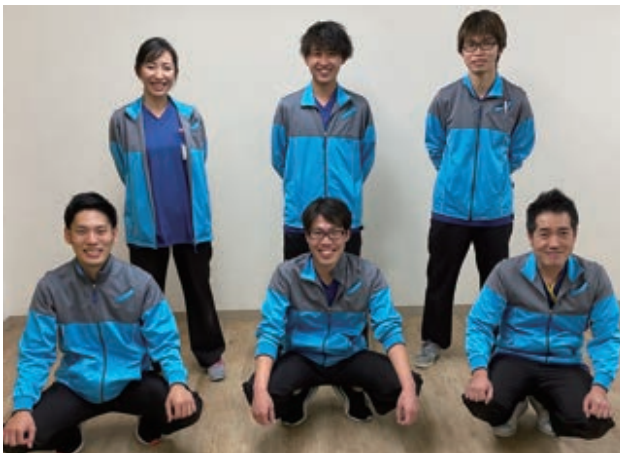
▲訪問リハビリテーションスタッフ