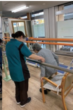
▲平行棒内動作訓練