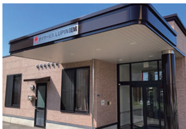
デイサービス LUPIN 斑鳩