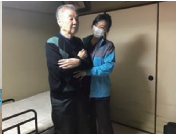
▲自主トレーニング指導