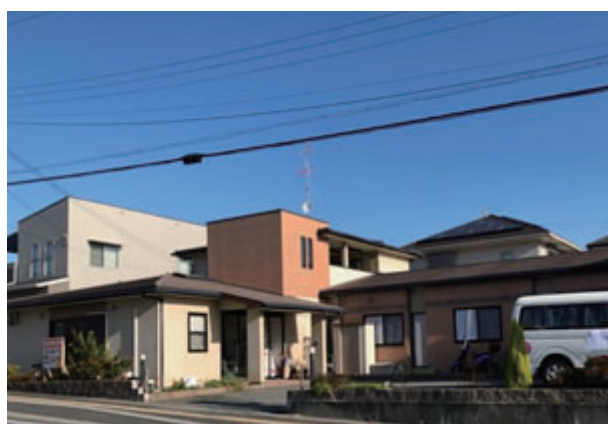
デイサービス LUPIN 勢野