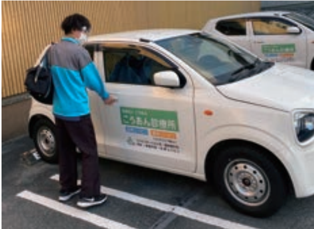
▲訪問車両に乗車するスタッフ

■医師の指示のもと、運動や作業を通じ、ご利用者様やご家族様が、在宅生活をより安心・安全に送っていただくことのできるよう、ご支援いたします。