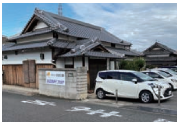
リハこどもデイクシア