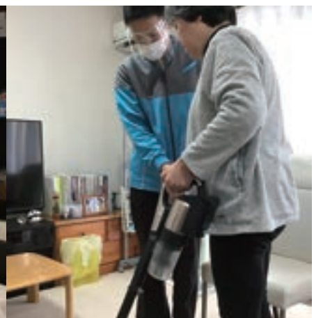
▲自宅での日常動作訓練と動作指導